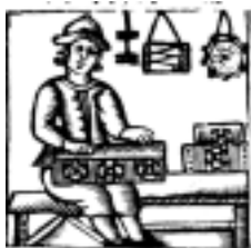
20 Venela jugamos de chino y con serio de haze Ping