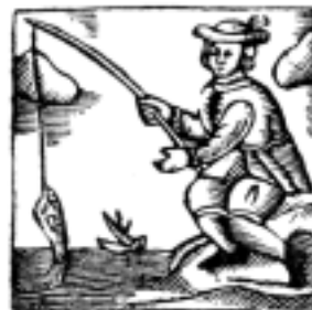
13. Diz el pescador de caba pierna mas de lo que gana.

del hombre en América. 2. Dar a conocer los resultados de las recientes investigaciones sobre el poblamiento temprano en América; 3. Crear un foro de discusión sobre los planteamientos de la migración, afinidad y antigüedad del hombre en América; 4. Definir una propuesta para diseñar una metodología específica para fechar los especímenes paleo-americanos y unificar los criterios de las mediciones y características morfológicas en el cráneo y el esqueleto poscranial, con la finalidad de formar un banco de datos para todo el Continente Americano y así, poder comparar la información con los datos de otras regiones del mundo. El Temario propone: Nuevos datos sobre la Antigüedad del Hombre en América; La antigüedad del hombre en América y sus posibles rutas de migración a través del Continente; Medio ambiente del Pleistoceno/Holoceno Superior en América: paleo-climas, geología, flora, fauna, etc.; La prehistoria en América; Características y afinidades genéticas del hombre americano. Fecha límite para el envío de resúmenes: 30 de junio. Informes: Dirección de Antropología Física, Museo Nacional de Antropología, Reforma y Gandhi S/N. Col. Polanco, C. P. 11560, México D. F., Telefax: (52-55) 55-53-62-04 y 52-86-19-33; correo-e: josejimenez_daf@hotmail.com; s.gonzalezdesherwood@livjm.ac.uk; xeljpp@amx.inter.net.