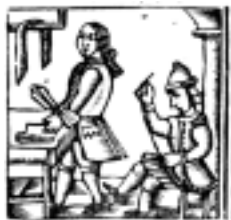
21 El saute al gran cestería safaento eta en la opintencia