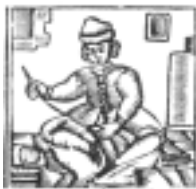
3. Acoplamiento de un objeto con su vaina de protección.