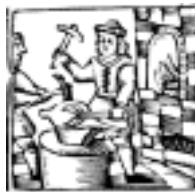
4. El herrador amarra la bola respetando y alineando.